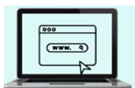
公式ホームページ 人材確保に関する改修